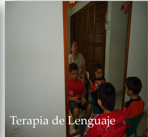
Terapia de Lenguaje