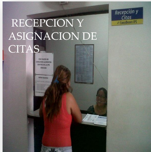
RECEPCION Y ASIGNACION DE CITAS