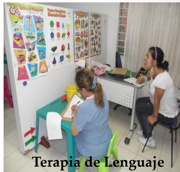
Terapia de Lenguaje