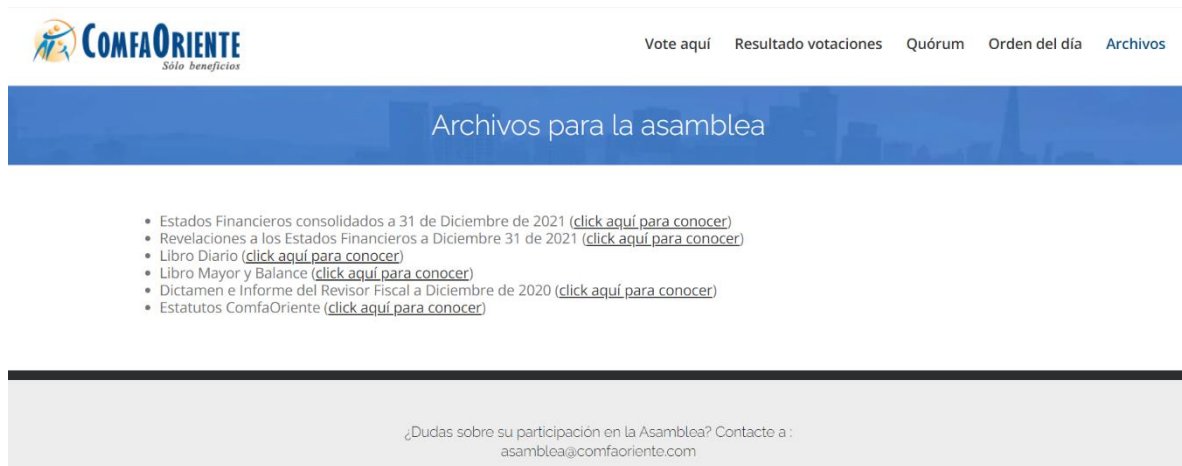
Ilustración 2 Imagen referencia de consulta de archivos