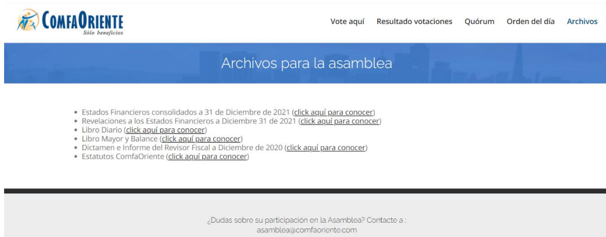
Ilustración 2 Imagen referencia de consulta de archivos