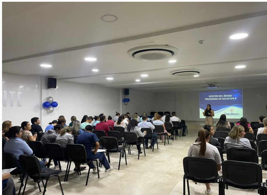
Actividad de capacitación funcionarios y contratistas del Programa de Salud EPS-S

Siete (07) jornadas de capacitación y divulgación del Sistema de Administración de Riesgos del Programa de Salud